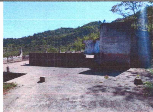
Foto 4: La foto muestra que se necesita levantar columnas, paredes, puertas y techo.