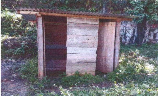
Foto 1: En esta fotografía se logra apreciar las condiciones en las se encuentran los sanitarios, se necesita cambio de paredes, tazas sanitarias, techo y las puertas.