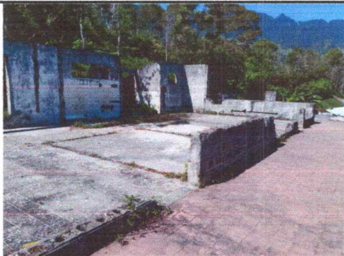
Foto 3: En esta foto se logra ver que la necesidad de remozar en grande, este espacio se usará para aulas.