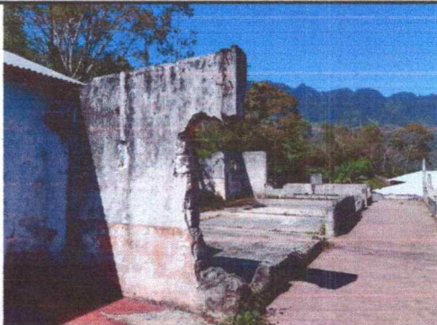
Foto 5: Se logra ver que es necesario remozar esta parte que se usará para aulas